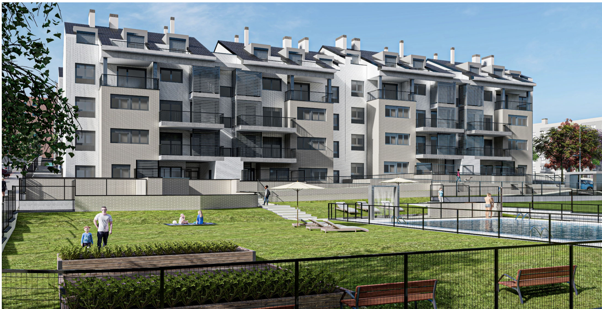
Urbanización y Zonas Comunes